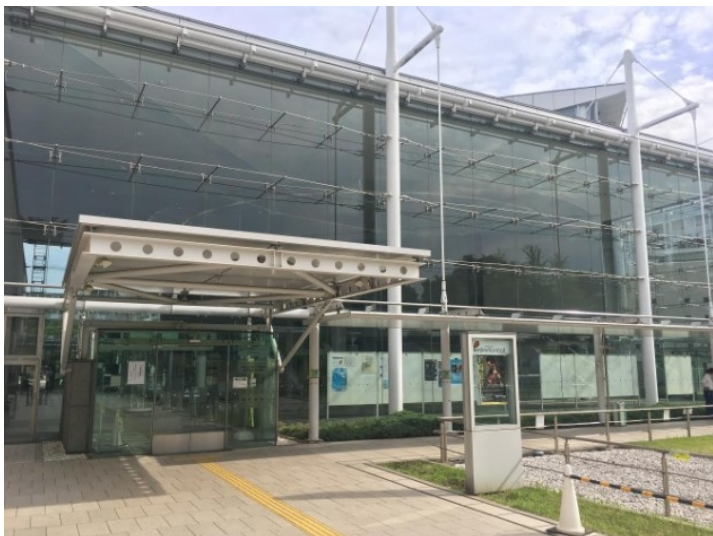
来年度の教科書閲覧可能はたった2か所のみ。中目黒学校サポートセンター・八雲中央図書館

子どもの将来にも大いに影響する思考、心の評価。子どもの事を第一に考えての教科書を選ぶことが求められます。