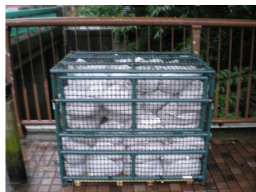
W1.2m × H1.0m × D0.8m